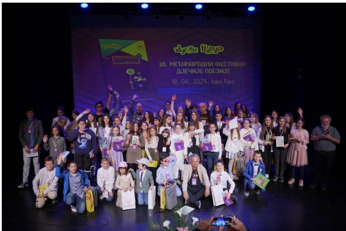
Za konec je nastala še skupinska fotografija finalistov.