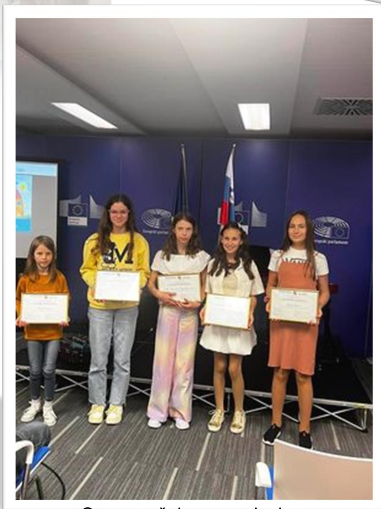
Osnovna šola - nagrajenke